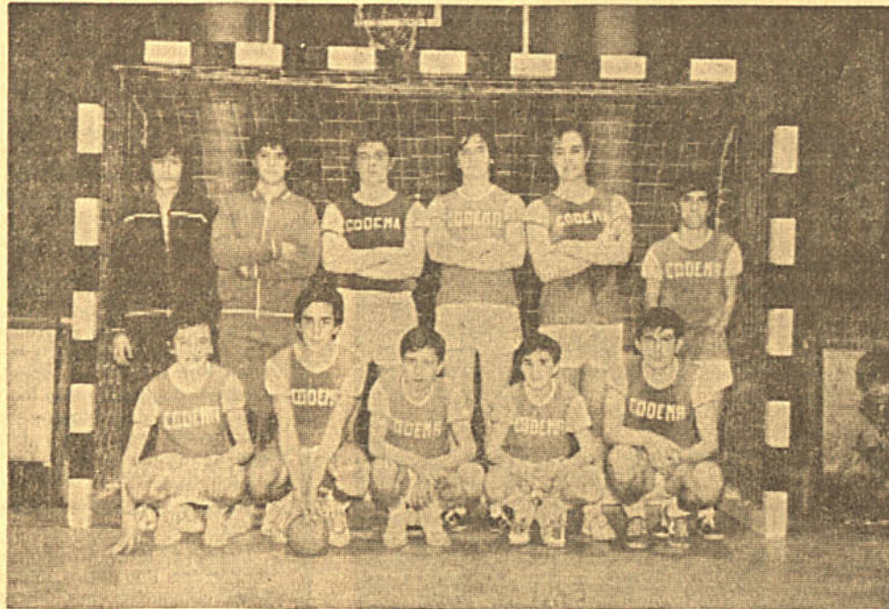
El equipo juvenil del colegio Corazón de María que se proclamó campeón de Asturias de Primera Categoría Juvenil. Algunos jugadores —tres concretamente— de los que figuran en ella no militan, actualmente, en sus filas.

En partido de promoción de ascenso a Primera Categoría Juvenil CUATRO TITULOS DE ASTURIAS PARA AVILES